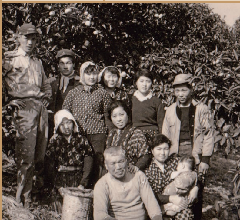
かつてのみかん農家